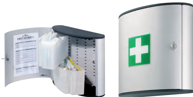
D-1970 prazan ormarić

Elegantan aluminijски ormarić za prvu pomoć sa zaključavanjem. Sadrži dva odjeljka za jednostavno spremanje. Dimenzije: 280 x 302 x 118 mm.