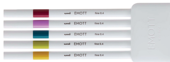
198628 Retro, pastelne boje