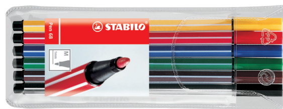
193379-G6 komplet 6 boja